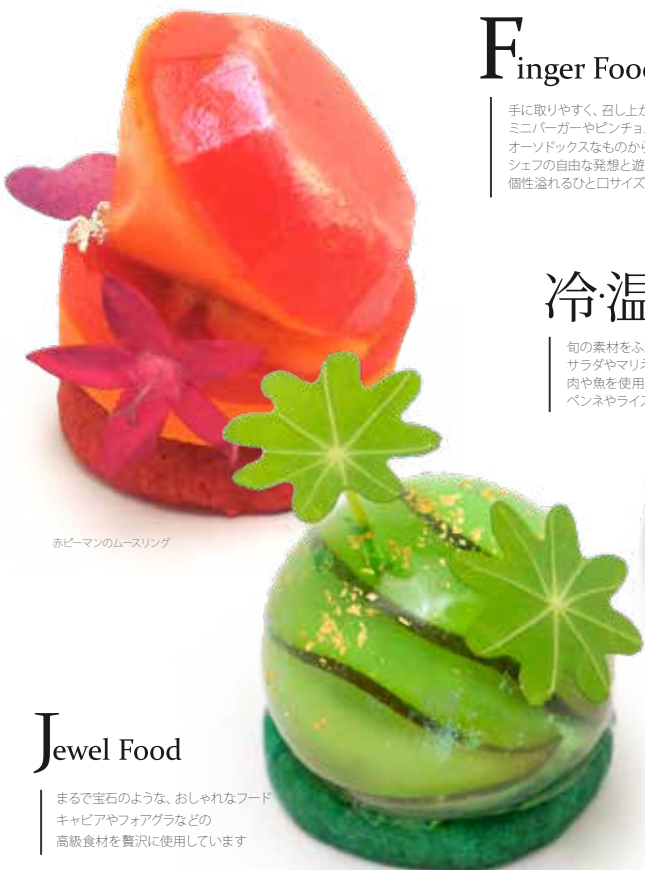
赤ピーマンのムースリング