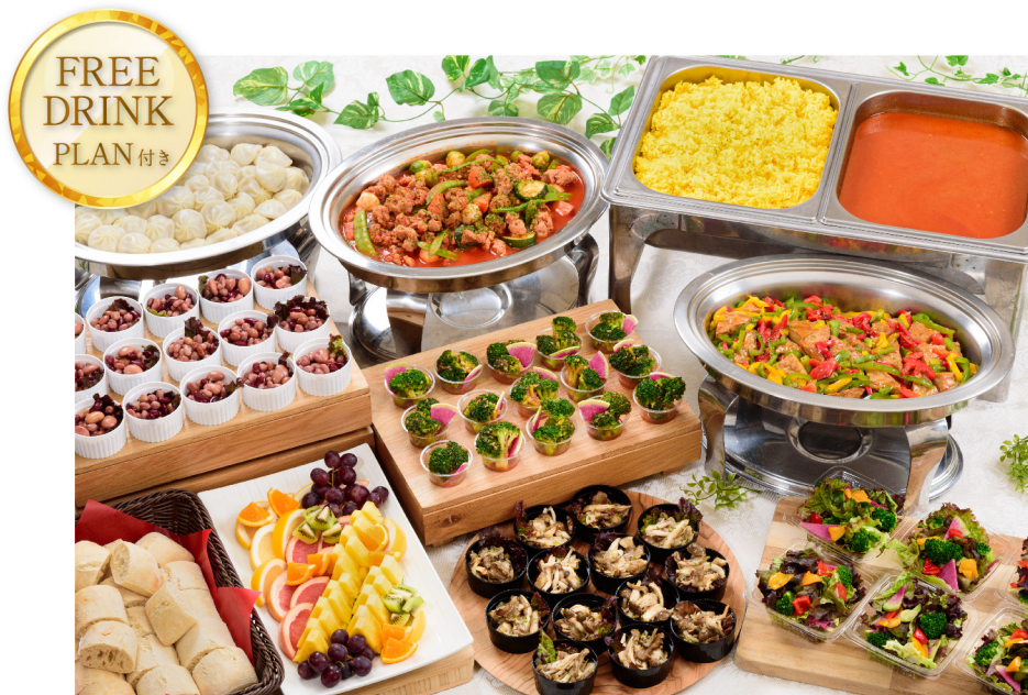
VEGAN VEGETARIAN PLAN