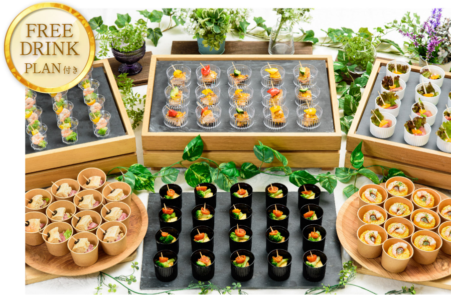
FINGERFOOD PLAN - LIGHT-